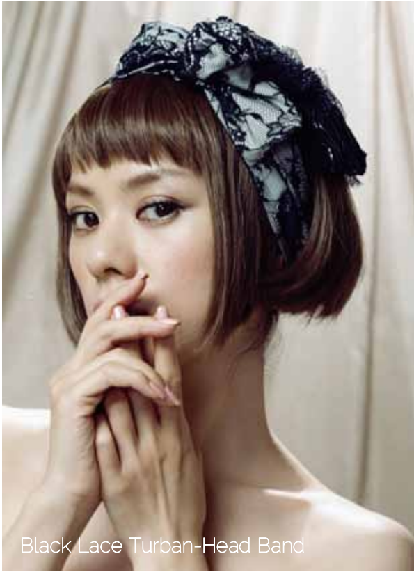
Black Lace Turban-Head Band