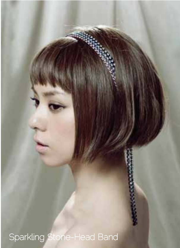
Sparkling Stone-Head Band