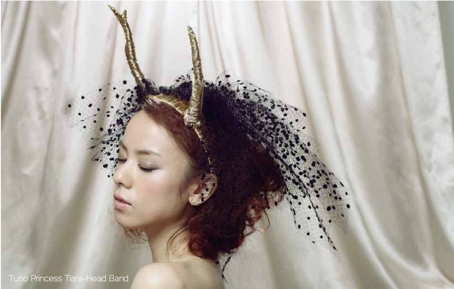
Tuno Princess Tiara-Head Band