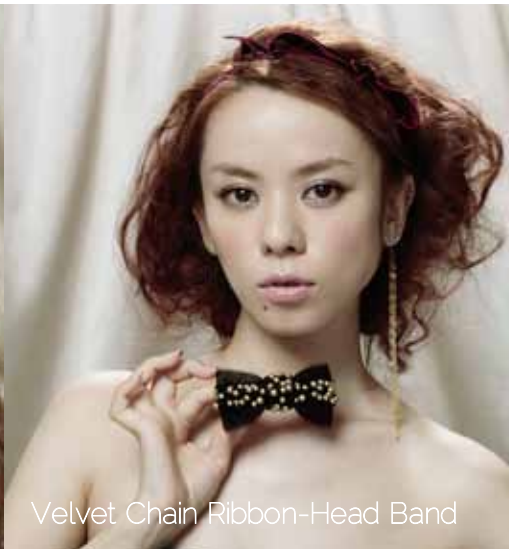
Velvet Chain Ribbon-Head Band