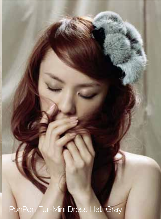
PonPon Fur-Mini Dress Hat_Gray