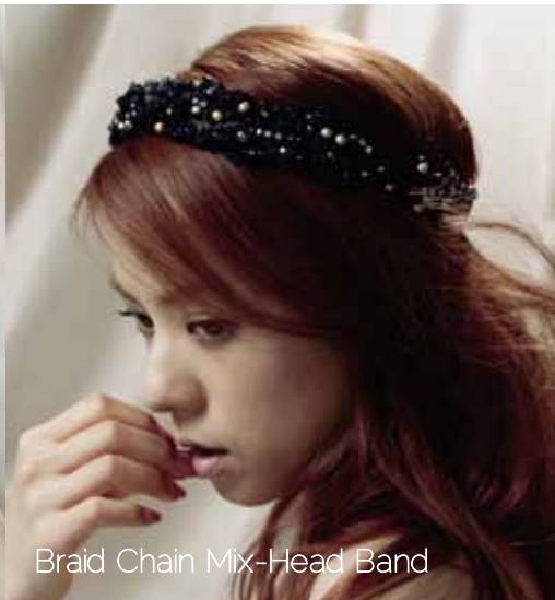
Braid Chain Mix-Head Band