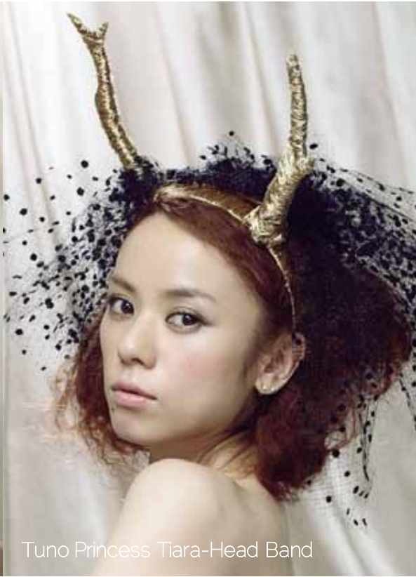
Tuno Princess Tiara-Head Band