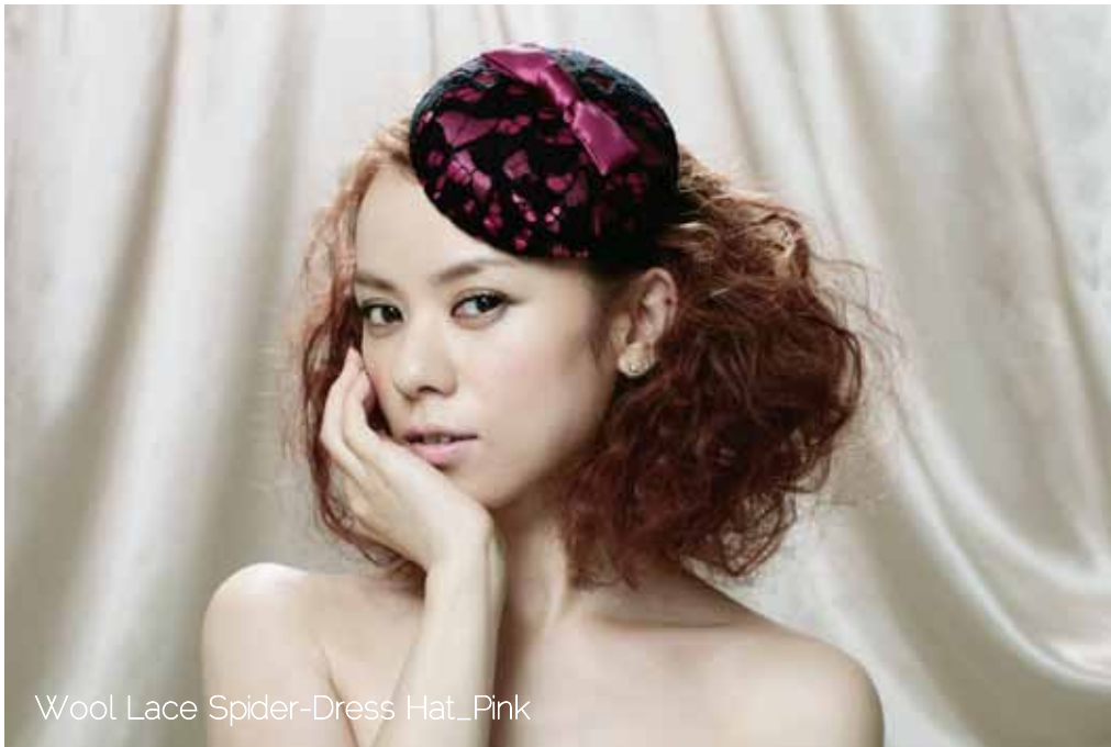
Wool Lace Spider-Dress Hat_Pink