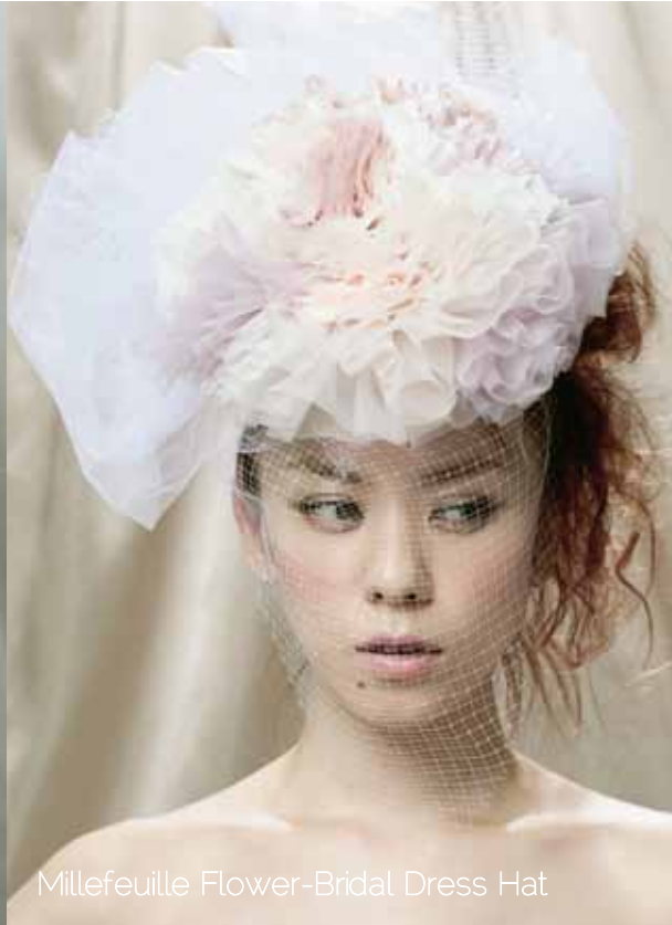
Millefeuille Flower-Bridal Dress Hat