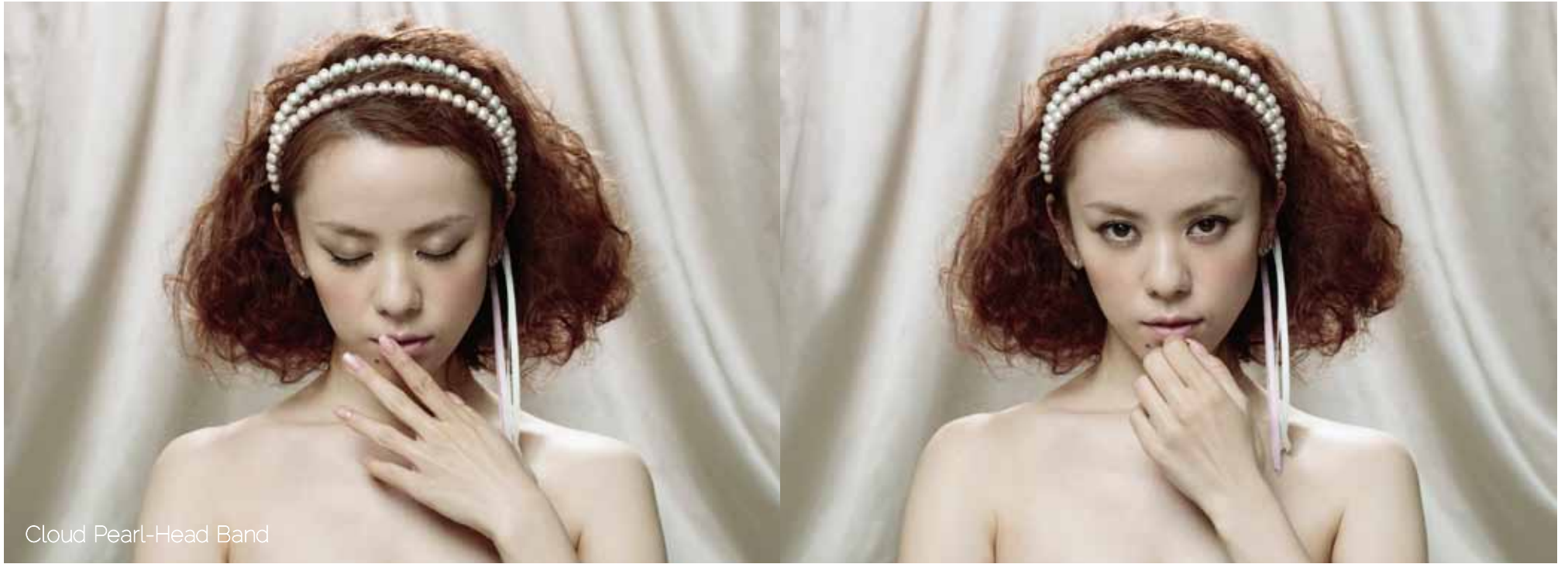
Cloud Pearl-Head Band