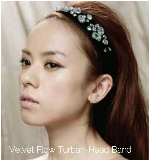
Velvet Flow Turban-Head Band