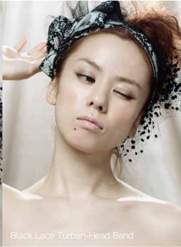
Black Lace Turban-Head Band