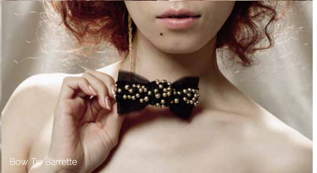
Bow Tie Barrette