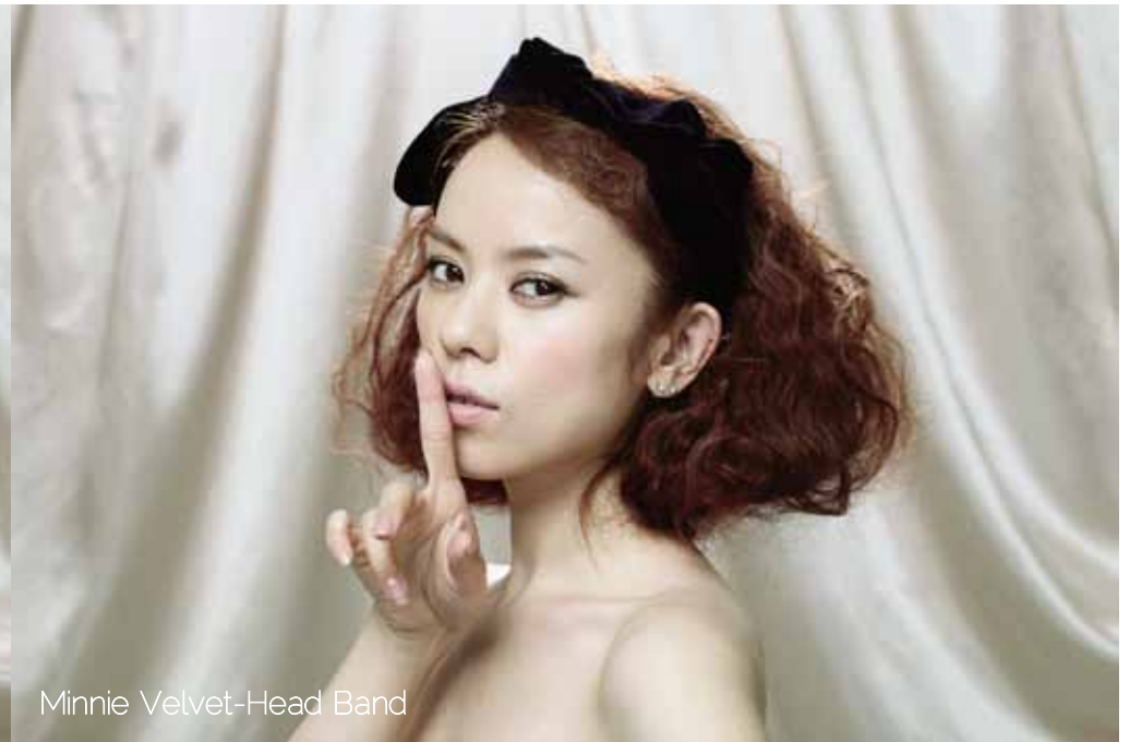
Minnie Velvet-Head Band